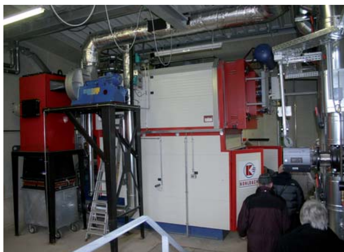
Das Herzstück der Anlage ist der Kesselraum