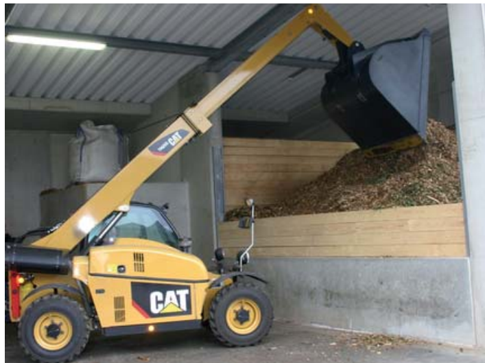
Die Holzhackschnitzelanlage wird mit Hackschnitzeln aus dem eigenen Forstamt befüllt.

Derartige Anlagen haben sich als sehr umweltfreundlich, kostengünstig und zuverlässig erwiesen. Besonders günstig ist es, dass das benötigte Holz auf dem Stadtgebiet reichlich zur Verfügung steht. Daher soll der Stadforst das Material anliefern.