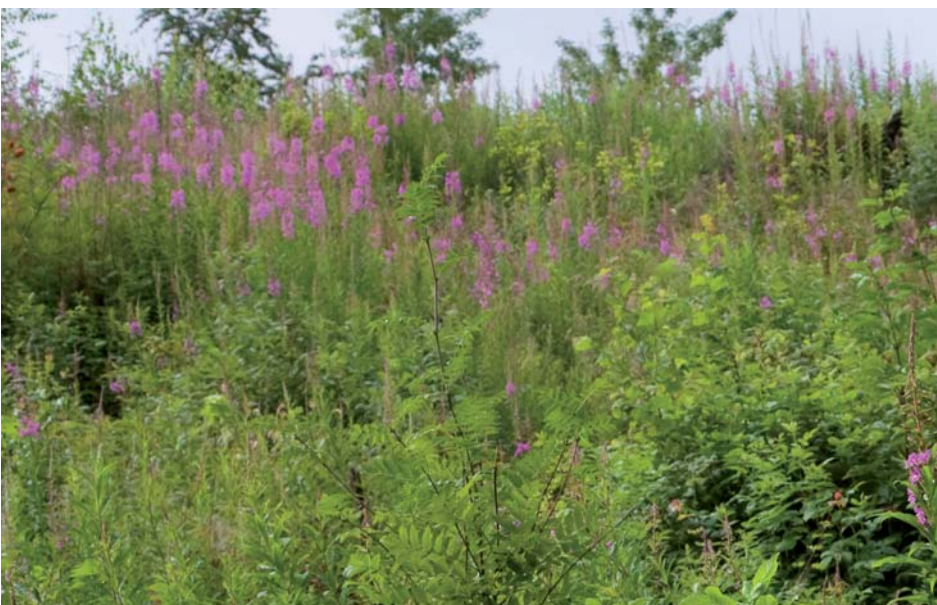
Chancen für den Wald nach Kyrill

Wir schaffen standortgerechte, ökonomisch und ökologisch gesunde Waldbestände, die sich an den Klimawandel anpassen und den touristischen Standort Brilon stärken. Wir gestalten eine langfristig stabile zukunftsfähige Waldlandschaft, die sich an kulturellen Werten orientiert. Je nach Schwerpunkt der Waldbewirtschaftung können wir die verschiedenen Interessen der Bürger in der Planung und Umsetzung berücksichtigen.